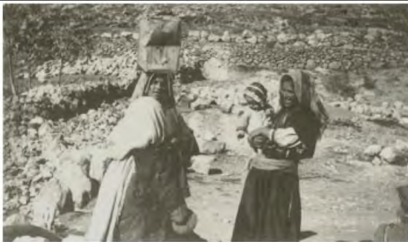
Figure 15. Hilma Granqvist (1935). Drawing Water . Plate 104.